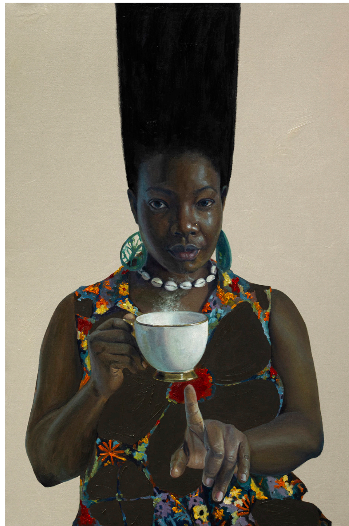
HELD IN POISE, 2025 Huile sur toile / Oil on canvas 175 x 112 cm