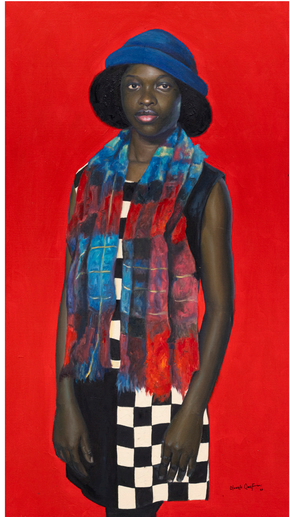
COMPOSED PRESENCE 2026 Huile et acrylique sur toile / Oil and acrylic on canvas 165 x 90 cm