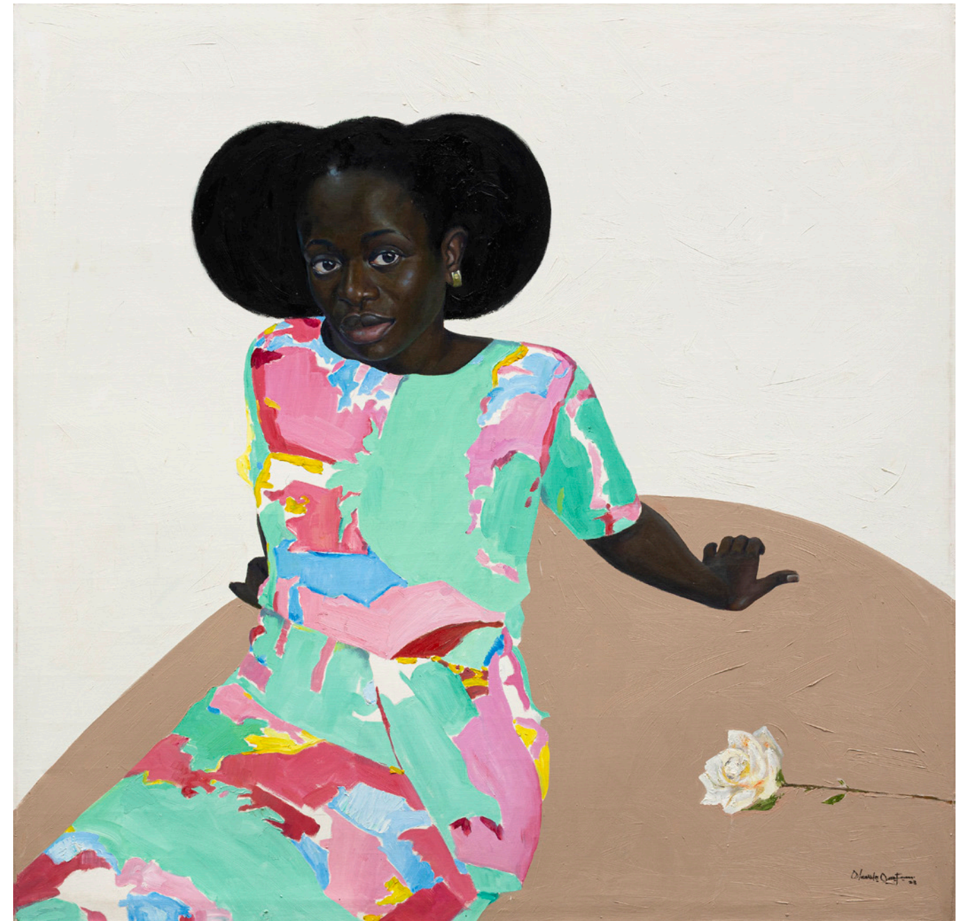
REST IN ELEVATION, 2023 Huile et acrylique sur toile / Oil and acrylic on canvas 154 x 154 cm