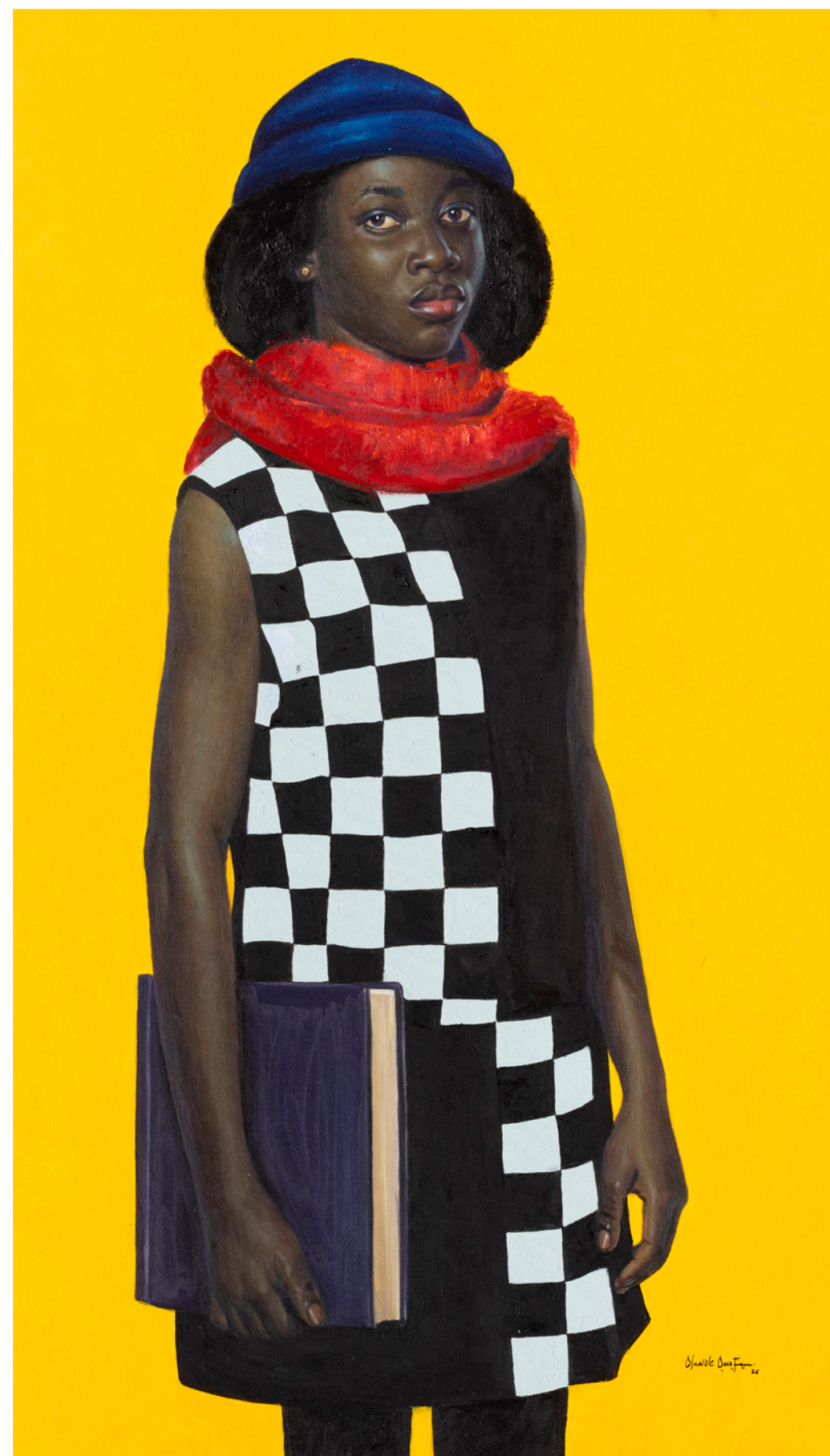
INHERITANCE, 2026 Huile et acrylique sur toile / Oil and acrylic on canvas 165 x 95 cm