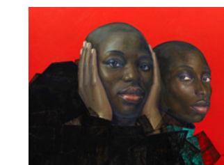
INWARD TURN, 2026 Huile sur toile / Oil in canvas 165 x 220 cm