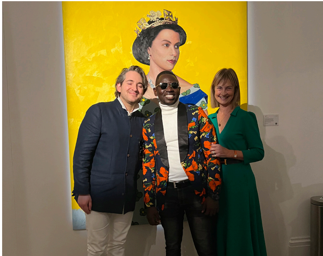
Cérémonie dévoilant le portrait de la reine Elisabeth II, réalisé en 2022 par l'artiste Oluwole Omofemi à l'occasion du jubilé de Platine de la reine