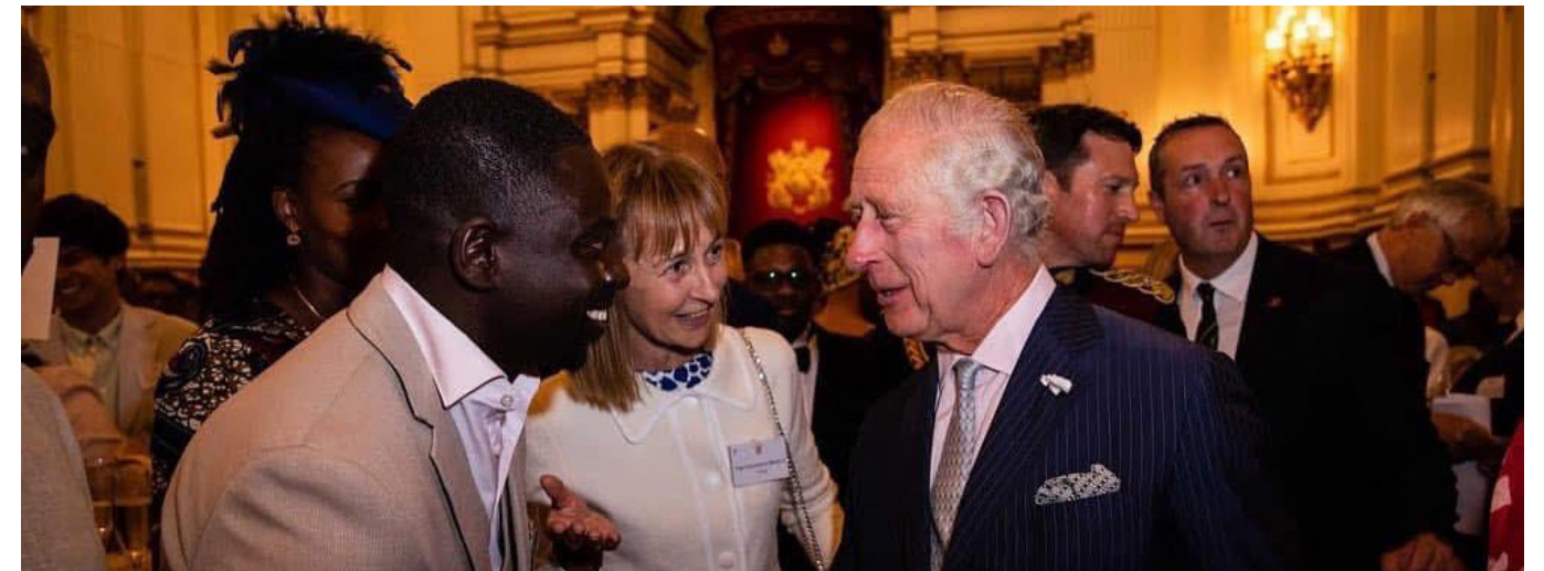
Oluwole Omofemi, reçu par le roi Charles III lors de la cérémonie du Jubilé de la reine Elisabeth II