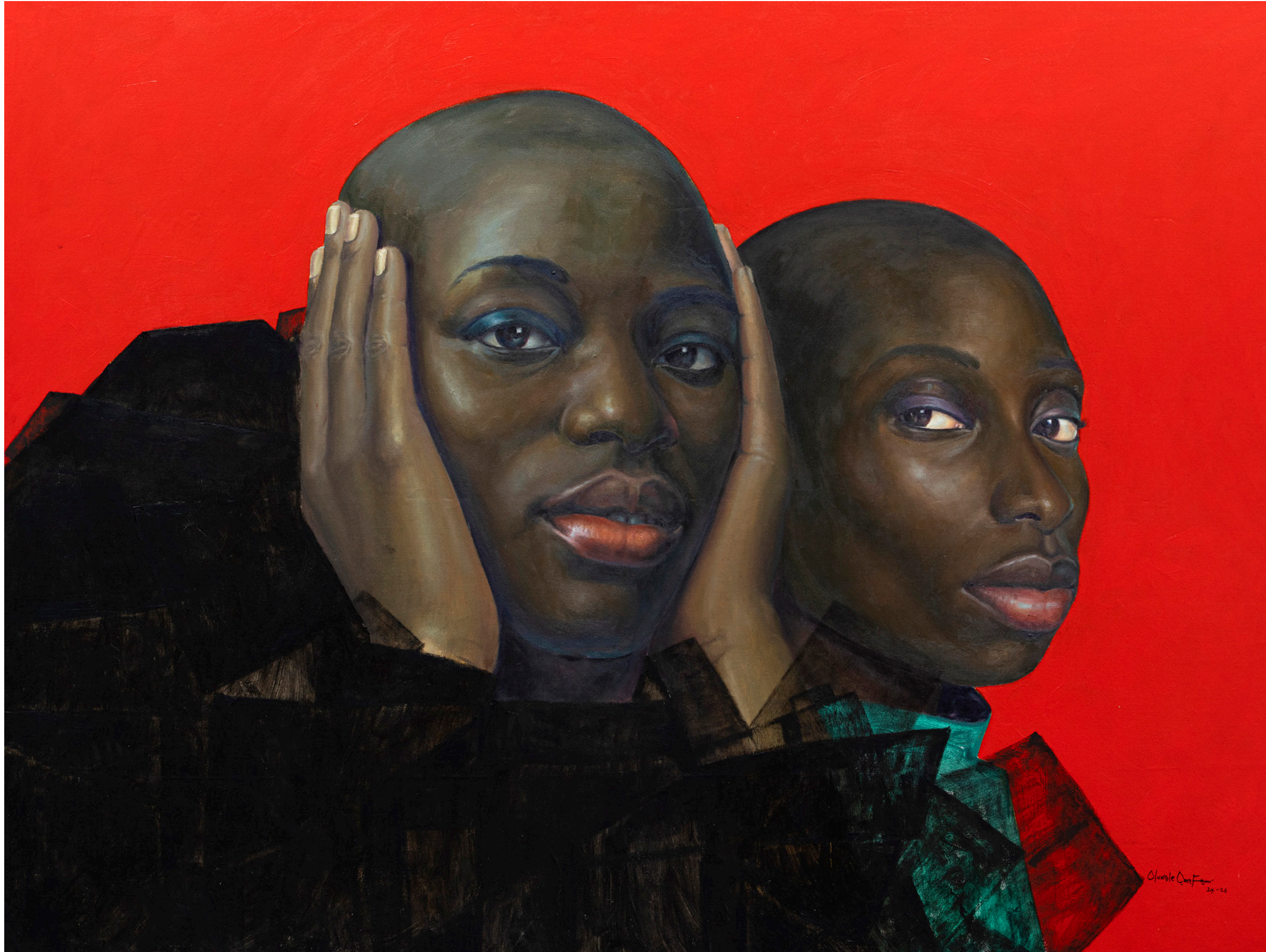
INWARD TURN, 2026 Huile sur toile / Oil in canvas 165 x 220 cm