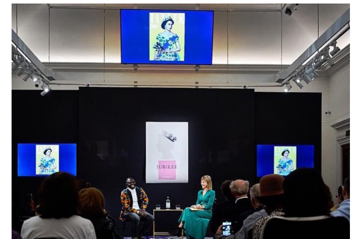
Conférence de presse à Sotheby's Londres